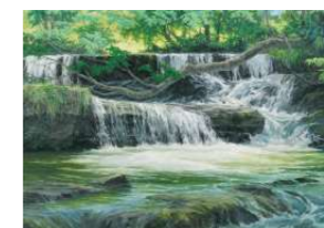
第110回記念光風会展光風記念賞 木南 暢子/一の滝