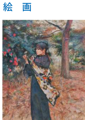
東京都知事賞 結城 唯善/風前花