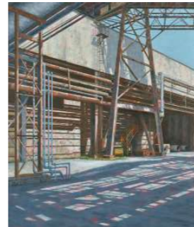
田村一男記念賞 井上 美知子/Shadow