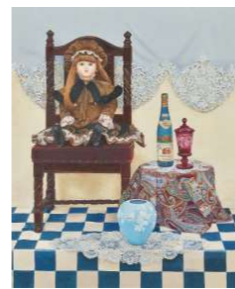
光風会会友賞 酒井 総子/午後のアトリエ