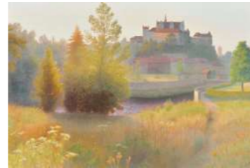
第110回記念光風会展会員記念賞 野口 俊介/朝の光の中で