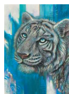
第110回記念光風会展会友記念賞 松本 優月/堂々