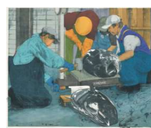
光風会会員賞 林 榮市/魚市場'24(版画)