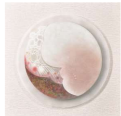
光風工芸賞 くり 友里/ 祝いのつぼみ 一紅玉石(石宝)