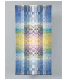
第110回記念光風会展会友記念賞 宮崎 優子/ とても遠いトコロ(織)