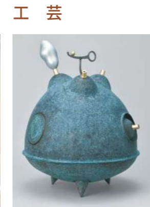
第110回記念光風会展特別記念賞 肥沼 徹/はみだした時間(金工)