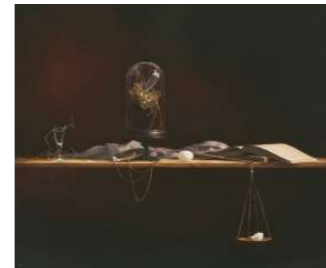
SOMPO美術館賞 福本 弥生/time on the table