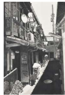
辻 永記念賞 清水 佳代子/ 昼下がりの家(版画)