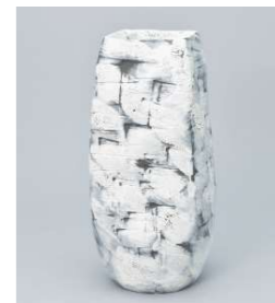
杉浦非水記念賞 細川 寛文/白跡(陶)