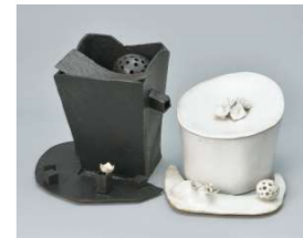
光風会会員賞 関谷 俊江/ 黒の四角と白の楕円(陶)