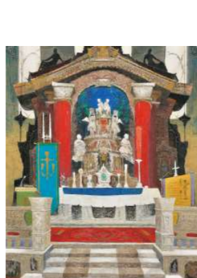
第110回記念光風会展特別記念賞 川村 隆夫/ヤコブ大聖堂